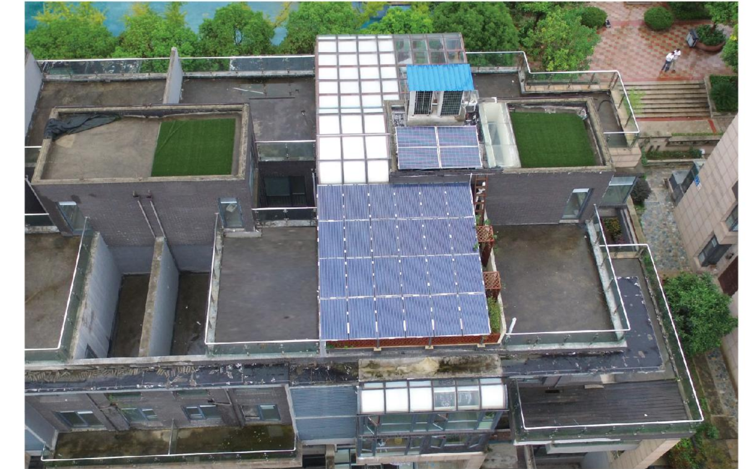
无锡山水湖滨·光伏阳光房