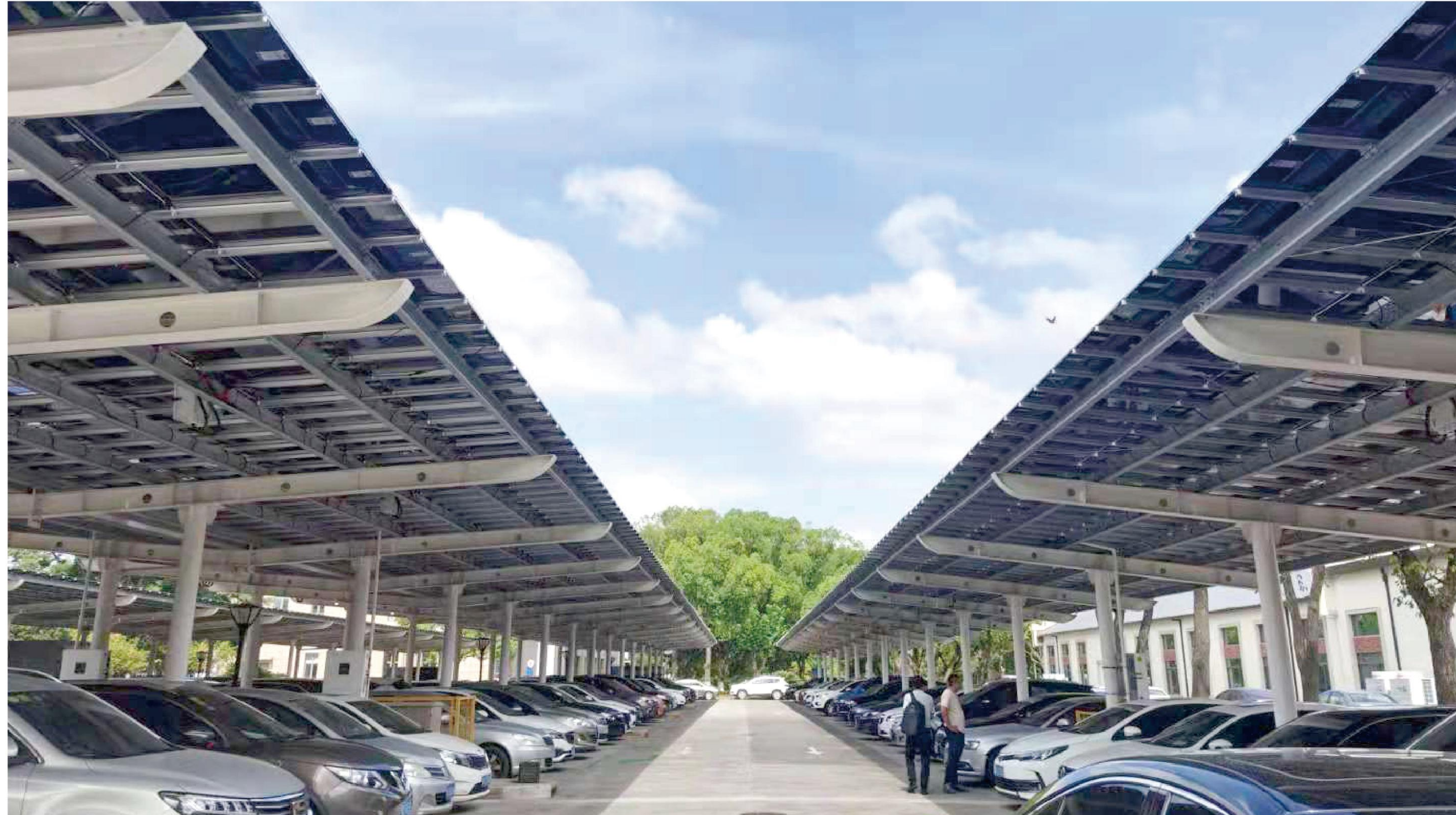
模块化太阳能车棚