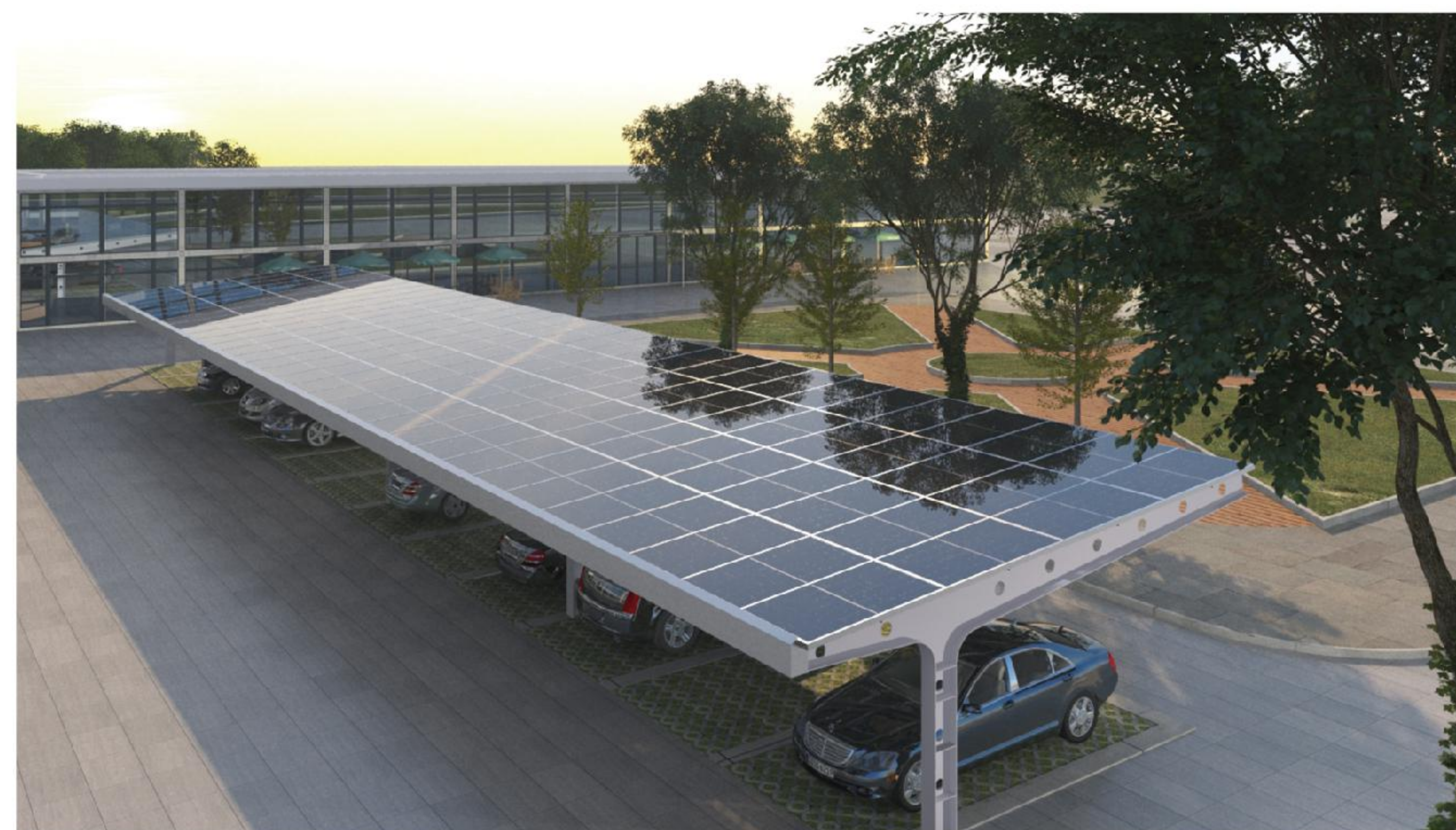
模块化太阳能车棚